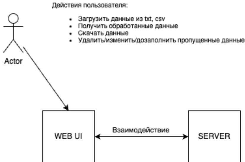
Рис. 1. Архитектура приложения

Получается следующая архитектура (рис. 1).